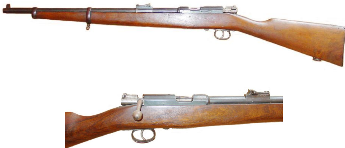
Carabina DESTROYER, primer modelo o "Md. 1921"

Probablemente, la patente obtenida por Gaztañaga en 1924 sería "partida de nacimiento" del segundo modelo de carabina DESTROYER, a alimentar con cargadores similares a los de las pistolas semiautomáticas Browning, con alojamiento o depósito que constituye prolongación del arco guardamonte, como los Mauser de repetición precedentes del Md. 1893