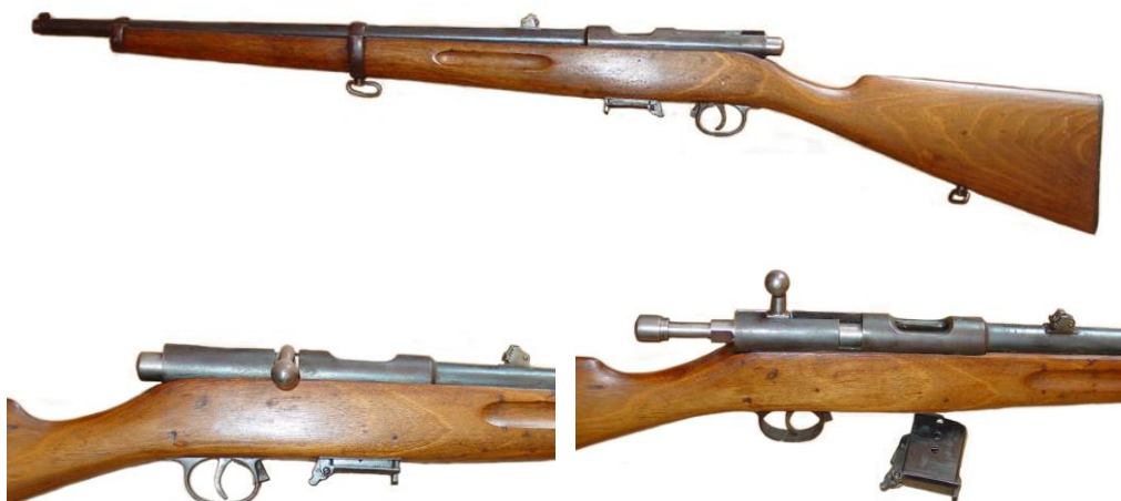
Carabina PAZ, para cartuchos 9 mm “Bergmann”, con marca de la firma Echave y Arizmendi – Eibar – con fecha 1925

El Museo Militar del Castillo de Montjuïc contaba entre sus fondos con dos carabinas PAZ, la primera, con número de fabricación 10241 y marca de la sociedad “Echave y Arizmendi”, la segunda, con número de fabricación 10841 y las iniciales FS en el