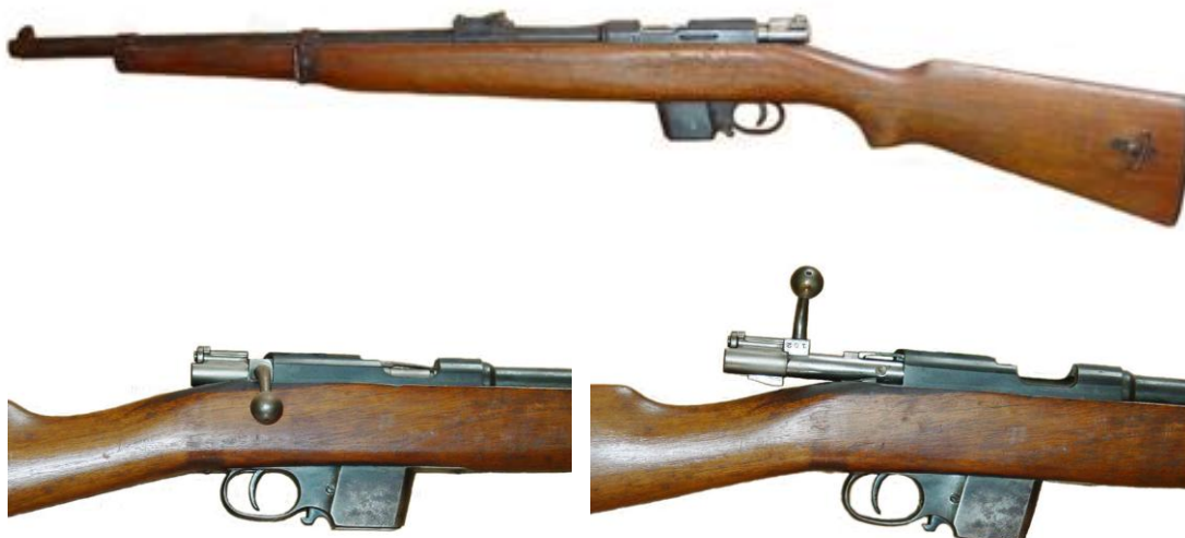
Carabina DESTROYER, segundo modelo

Probablemente, la patente obtenida por Gaztañaga en 1924 sería "partida de nacimiento" del segundo modelo de carabina DESTROYER, a alimentar con cargadores similares a los de las pistolas semiautomáticas Browning, con alojamiento o depósito que constituye prolongación del arco guardamonte, como los Mauser de repetición precedentes del Md. 1893