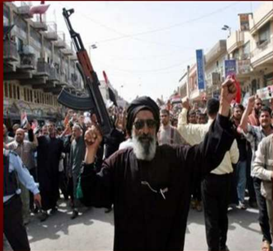
Clérigo Musulmán de Argel