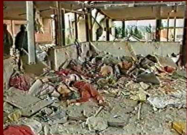
Iglesia Copta atacada durante celebraciones litúrgicas.

Jovencitas cristianas son secuestradas, casadas y obligadas a convertirse al Islam..