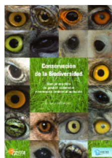
CONSERVACIÓN DE LA BIODIVERSIDAD.