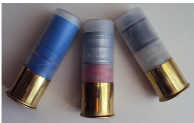
Da sinistra: cartuccia assemblata con palla Gualbo, per tiro; al centro cartuccia assemblata con palla MAGNUM da 38 gr., per caccia e all'estrema destra la munizione assemblata con la CLASSICA borra proiettile Gualandi da 32 gr.