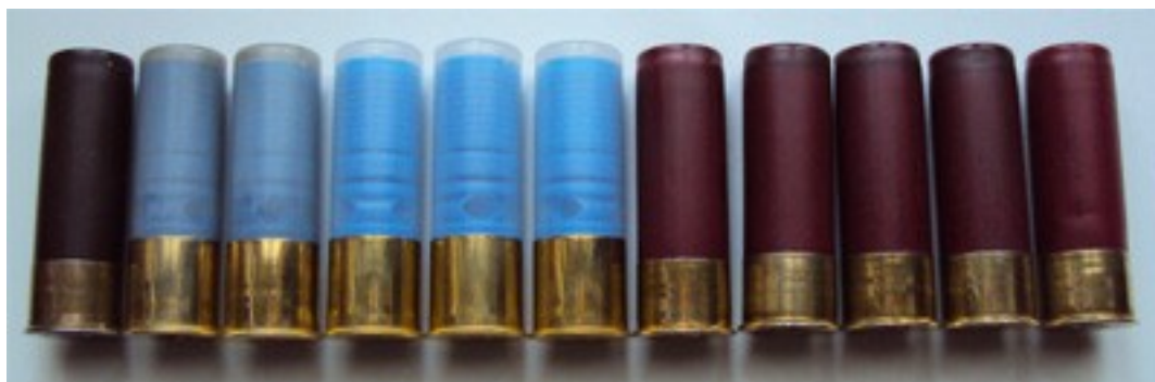
Munizioni cal.12/70 da sinistra tre cartucce ricaricate dopo la prova, al centro (colore celeste) bossoli nuovi appena ricaricati mentre i cinque bossoli restanti, marca Federal a destra (color amaranto) sono stati ricaricati anche loro con palle Gualbo e polvere GM3 (1,65gr.)

La stessa prova è stata condotta anche con bossoli da 70mm.