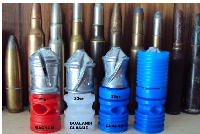
Nella foto sopra da sinistra: palla magnum, borra proiettile, gualbo da tiro senza sabot e completa di sabot

TRE PROIETTILI SON MEGLIO DI UNO: i tre proiettili si basano essenzialmente sulla forma ormai collaudata del classico “borra proiettile” Gualandi da tutti riconosciuto come tra i più precisi anche sulle lunghe distanze. La vendita sempre maggiore di armi con canna magnum e super-magnum ha spinto Gualandi a produrre una palla adatta anche a queste canne. E' nata così la palla Magnum Gualandi da 40 grammi, ben più massiccia e dalla faccia anteriore meno acuminata per garantire uno shock da impatto maggiore sul selvatico. La borra o codolo, applicato alla base e di colore rosso, è di forma identica alla classica palla ma ben più resistente dovendo sopportare sollecitazioni maggiori all'atto dello sparo. La palla ha una doppia scanalatura molto profonda e di forma elicoidale capace di darne una minima rotazione stabilizzatrice e tre anelli di tenuta o forzamento, il cui diametro è di 18,6 mm. Per il primo in punta al proiettile, 18,17 il secondo e 18,6 quello più vicino al codolo, la lunghezza della parte in piombo è di 25,52 mm. e di 48,66 mm. completa di codolo.