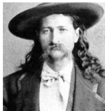
Nuestro mítico Will Bill Hickok con el típico aspecto “fronterizo”.