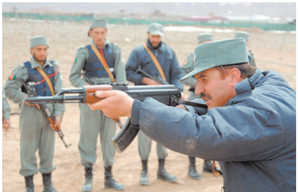
Un instructor de las fuerzas del orden de Afganistán realiza una exhibición de cómo usar correctamente un Kalashnikov ante la atenta mirada de sus alumnos.