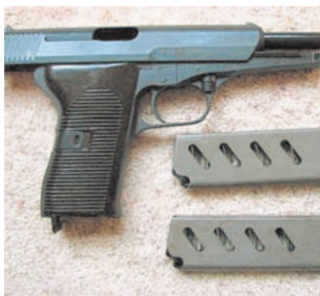
CZ-52 con la corredera abierta y 2 cargadores.

que habla bien a las claras de su gran versatilidad. La versión original de la CZ-52 se alimenta con cargadores extraíbles con capacidad para almacenar hasta 8 cartuchos del calibre 7,62x25mm. Uno de los apartados más destacados de esta pistola es su seguridad. En este sentido, este modelo salía equipado de serie con seguro de aguja percutora. Durante muchos años la CZ-52 sirvió como arma de dotación entre las fuerzas del orden de Checoslovaquia.