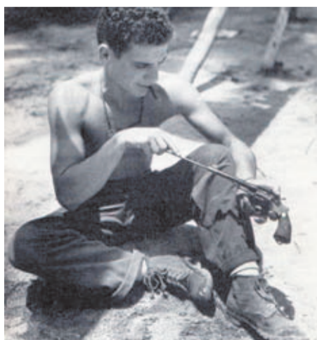
Soldado estadounidense limpiando su M&P.

Tras la guerra, los Victory fueron enviados de nuevo a Estados Unidos donde se les cambió el calibre al .38 Special original, pero el cambio, en plena posguerra, no fue muy efectivo y eran muchos los revólveres