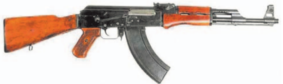
La figura del AK47 es muy fácil de identificar: culata y guardamanos de madera y cargador curvo.