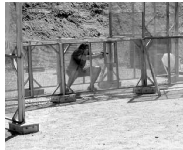
El tirador Gorka Ibáñez tratando de obtener la mejor posición para completar con acierto el stage número 14.

El campo de tiro de Pena Revolta, escenario de la prueba, es una preciosidad. Está situado a 5 km al sur de As Pontes, a 25 km al oeste de Vilalba y a 80 km al este de A Coruña. Las comunicaciones son muy buenas y los accesos son un lujo en comparación con lo que nos tienen acostumbrados otros campos. Dispone de una cafetería con unos menús muy completos y a un precio excelente. Además, en la misma zona de ejercicios se instalaron algunas carpas (a pesar de la sombra que provocaban los frondosos árboles) para dar más sombra y acoger un bar con unas cuantas mesas que nunca se llegaron a llenar.