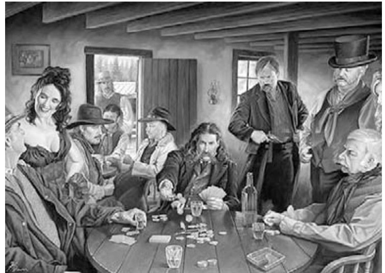
Este grabado ilustra el asesinato de Hickok a manos de Jack McCall.

1º. El enfrentamiento policial, en esa época, como hoy, ya se daba a muy cortas distancias. Antes se ha dejado expuesto un caso concreto, pero son muchos los que se pueden rescatar de las memorias y biografías de las viejas leyendas del Far West. Otro ejemplo, digno