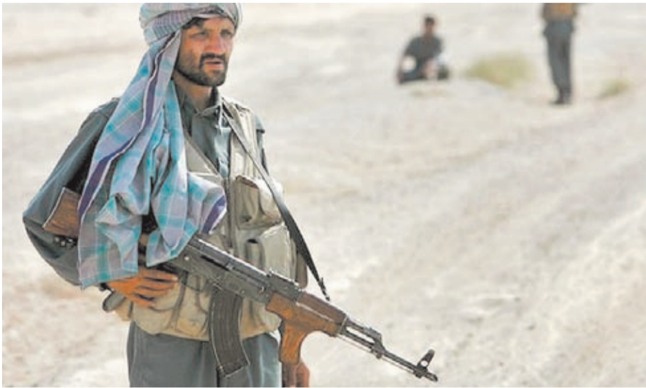
En primer plano, un soldado del ejército afgano sujeta un AK. Este económico fusil se ha convertido en el símbolo de la lucha armada de numerosos países.

pias versiones del AK47. Entre estos variados productores se encuentran países bajo influencia comunista, como Cuba, China o Corea del Norte, además de otras naciones más "occidentalizadas" como Finlandia, Sudáfrica, e incluso Estados Unidos. Por otro lado, el eficaz sistema de toma de gases del Kalashnikov también ha servido como fuente de inspiración para muchos otros diseñadores de armas que se han basado en la figura del AK para fabricar sus propios fusiles de asalto. Este es el caso por ejemplo del Galil israelí (ver el reportaje especial del número de Agosto-Septiembre 2010 dedicado a las armas del Tzahal), o del Valmet finlandés. Ambos modelos imitan el espartano pero efectivo diseño del AK47, reproduciendo incluso la clásica figura curvada de sus cargadores extraíbles.