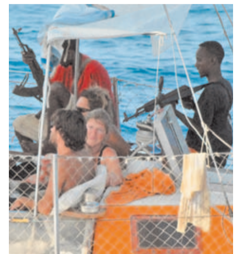
Piratas del siglo XXI armados con rifles AK.