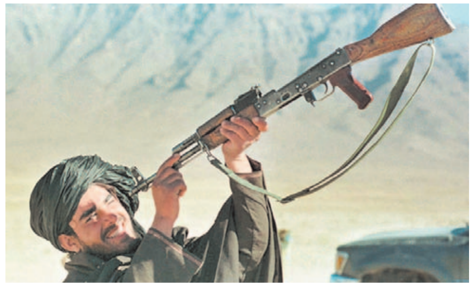
Curiosa imagen de un soldado árabe comprobando la recámara de un rifle Kalashnikov.

El AK original se asemeja bastante a sus derivados, sobre todo al Type 56 chino