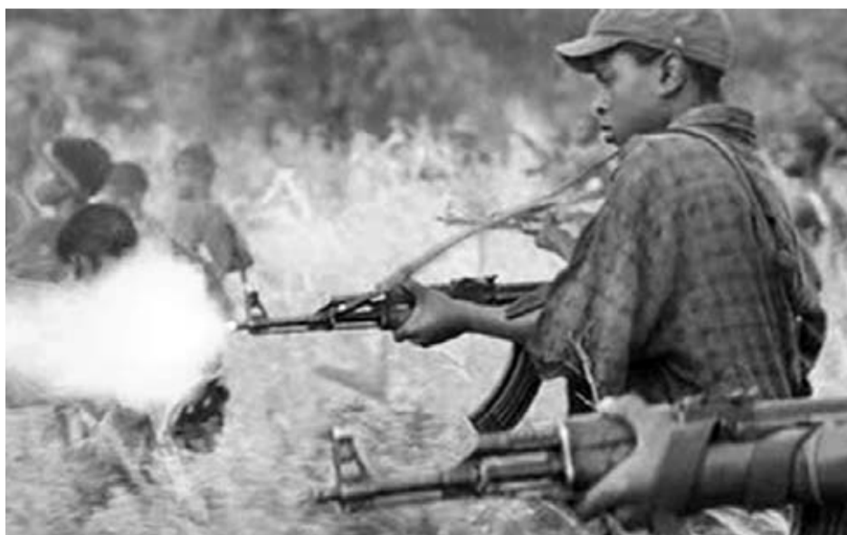
Varios niños disparando con rifles Kalashnikov en una escena del film “Diamantes de sangre”.