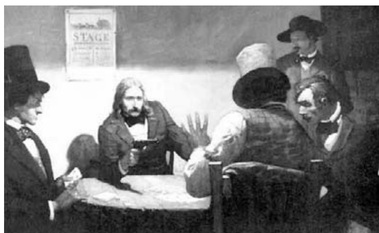
Como muestra este dibujo, Hickok casi nunca daba la espalda a la puerta.

7º. El estado de alerta permanente le mantuvo vivo más tiempo, aunque al final la muerte le llegara por descuidar la retaguardia durante aquella fatídica partida de cartas.