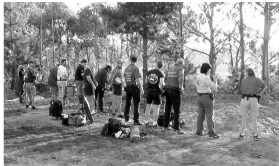
Una fila de tiradores se dispone a preparar sus armas para la competición en la fresca mañana de As Pontes. Las medidas de seguridad se cumplieron arrojablemente durante toda la prueba.

El séptimo ejercicio, mejor llamado "la lotería", era un ejercicio más corto, de 8 disparos. De salida tenías un gong con tarjeta y un PP que accionaba 2 móviles que salían a una velocidad tremenda y solo se veían parcialmente entre unas filas de neumáticos, unos 15cm de visto y no visto. El