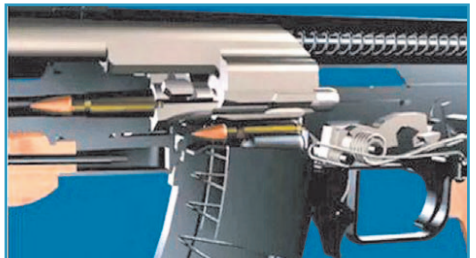
Explicación gráfica del sistema de acción de un AK www.armas.es/videos

Los fusiles AK no han sido ajenos a la evolución tecnológica y hoy en día podemos encontrar en el mercado actual versiones más modernas del arma ideada por Mikhail Kalashnikov. Detrás de toda esta producción se halla la empresa IZMASH , ubicada en la localidad rusa de Izhevsk. Desde este arsenal surgen actualmente todos los rifles que componen la gama AK-100 . Compuesta por cinco modelos (AK-101, AK-102, AK-103, AK-104, y AK-105), esta nueva línea de rifles Kalashnikov se caracteriza por recurrir al polímero como principal material para su estructura, así como por ofrecer un moderno acabado en color negro mate. Los modelos AK-101 y AK-102 disparan munición del calibre 5,56x45mm OTAN; los AK-103 y AK-104 mantienen el calibre original 7,62x39mm; mientras que el fusil AK-105 es el único que se alimenta con cartuchos del 5,45x39mm, el mismo calibre que utiliza el AK-74 (el cual, por cierto, también se sigue fabricando en el arsenal de Izmash).