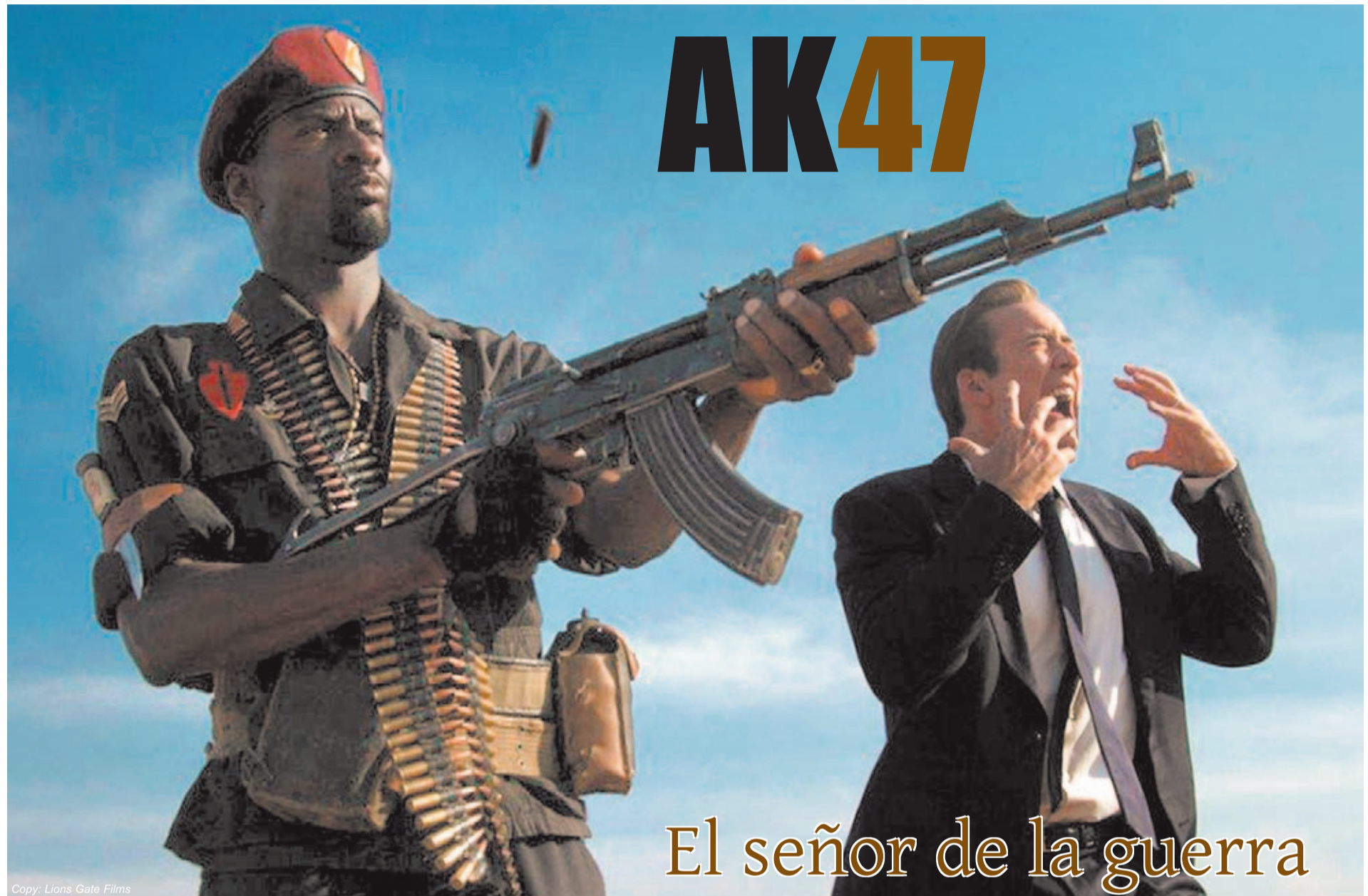
Copy: Lions Gate Films

El legendario diseño de Mikhail Kalashnikov convertido en icono popular