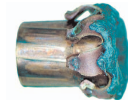
Proyectil deformado de un cartucho del .38 Spl

que el .38 Special se presenta como un cartucho de baja presión, cuyos mejores resultados de precisión se obtienen con velocidades inferiores a los 250 metros/segundo y con proyectiles tipo "wadcutter" (punta chata).