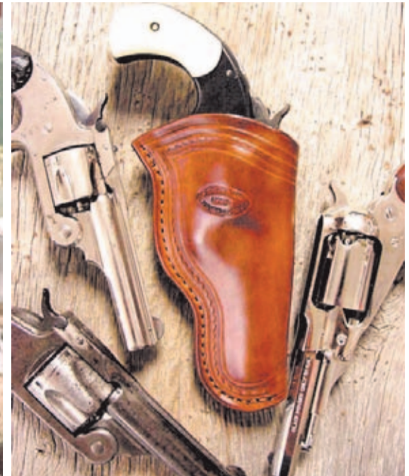
Recopilatorio de armas y fundas usadas en el Far West.

revólver de Tutt tenía una recámara vacía: solo tenía vaina la recámara correspondiente al último disparo. Con total seguridad, Davis Tutt erró el disparo contra su rival. Tomen nota: Tutt gozaba de gran fama como tirador de precisión. Se sabe que Hickok apoyó el cañón de su Colt Navy mod.1851 calibre .36 en su antebrazo débil, consiguiendo lo que esperaba: un disparo preciso a una distancia “interesante”. También es sabido que por aquella época, y en ocasiones, usaba un revólver Colt Dragon calibre .44 y un S&W nº2 calibre .32.