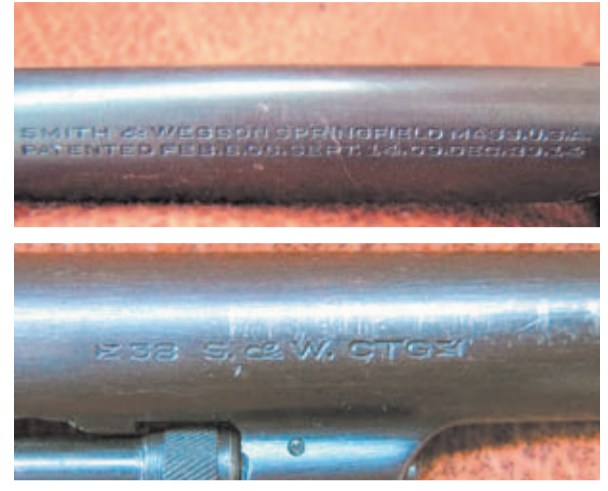
Detalle de los diferentes marcajes del revólver.

USA, entregándose como dotación para la Marina y para los miembros de las Fuerzas Aéreas, aunque los apuntadores portaban obligatoriamente la pistola Colt 1911.A-1. Estos militares iban tendidos en la nariz del avión y su misión consistía en apuntar y soltar las bombas, con la orden de que si el avión sufría una avería y no podía salvarse, antes de abandonarlo debían destruir a tiros la mira "Norden". Los yanquis la consideraban un alto secreto militar similar a la máquina "Enigma" alemana.