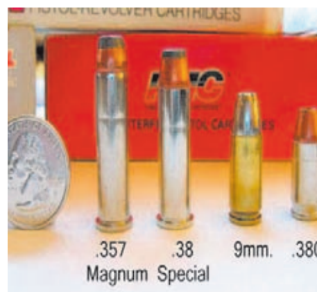
Foto comparativa con cartuchos de arma corta.

Dado que se trata de dos cartuchos con un diseño exterior casi idéntico, la munición del calibre .38 Special puede dispararse desde un revólver con recámara del .357 Magnum. Sin embargo, por motivos de seguridad, desde un revólver con recámara del .38 S&W, no se pueden disparar cartuchos del calibre .357 Mag. Esta compatibilidad en muchas ocasiones al calibre .38 Special, sobre todo entre los tiradores deportivos, quienes encuentran en esta munición mejores precios de compra (es más económica que la del .357 Magnum), menos retroceso después de cada disparo, y por lo general mayor precisión. Sobre este último aspecto habría que convenir