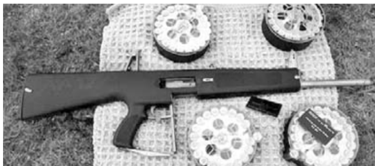
Escopeta automática AA-12 con varios cargadores de tambor.

Uno de los aspectos más destacados de la AA-12 es su enorme potencia. En este sentido, en modo automático esta escopeta es capaz de ofrecer una cadencia de fuego