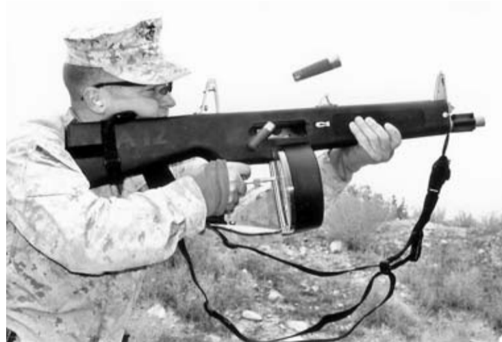
Marine estadounidense realizando pruebas de tiro con la escopeta AA-12.

-Miras: Abiertas de hierro -Longitud del cañón: 45,7 cm -Longitud total: 97 cm -Fabricante: MPS (EEUU)