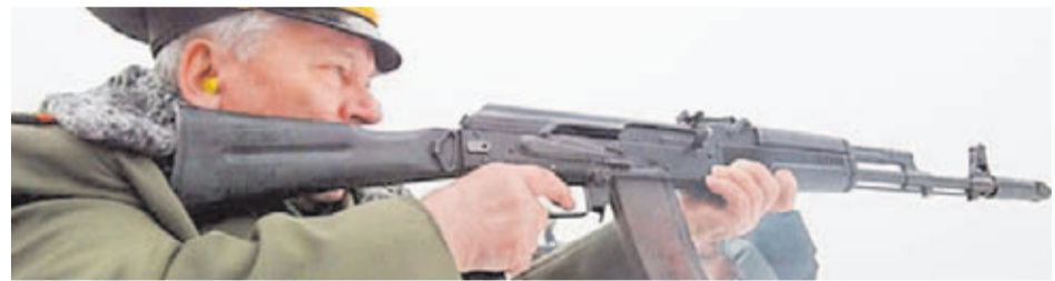
Mikhail Kalashnikov disparando con su propia creación.

74, AKM (con el cajón de mecanismos de acero estampado), y por supuesto AK-74. Esta liberalización supuso el primer paso de lo que llegaría tras la caída del Muro de Berlín, el final del Pacto de Varsovia y el desmoronamiento de la URSS. En este sentido, a partir de la década de los 90, Rusia ha trabajado incansablemente en el lanzamiento de nuevos modelos de fusiles tipo Kalashnikov, llegando a convertirse en una de las principales fuentes de ingresos de la débil economía post-comunista.