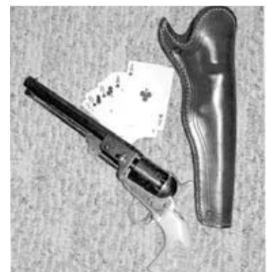
Esta jugada de póker pasó a conocerse como “la mano del muerto”.

de un artículo, es el archifamoso suceso de OK Corral con los hermanos Earp y unos pistoleros muy conflictivos. Aunque lo de Tombstone fue quizás más personal que profesional, no deja de ser un encuentro armado a muy corta distancia.