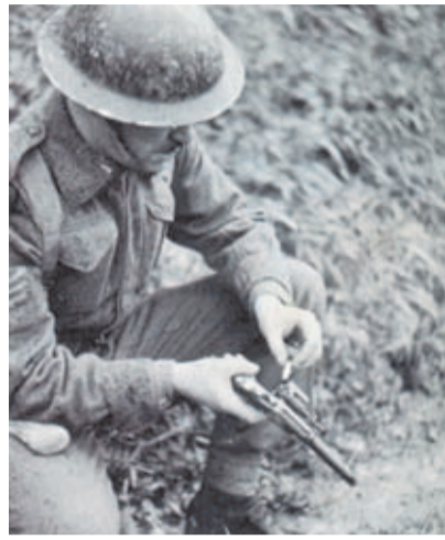
Soldado cargando su S&W M&P.

El revólver de mi colección y que aparece fotografiado en este reportaje tiene un número de serie inferior a 1.000.000, por lo que no es un Victory. Fue fabricado en Octubre de 1941 para el ejército norteamericano, justo dos meses antes de que EEUU entrara en la guerra tras el ataque japonés a Pearl Harbor. Sobre la solera del cañón lleva marcada en dos líneas la siguiente inscripción: "SMITH & WESSON SPRINGFIELD MAS. USA. PATENTED FEB. 6. 06. SEPT. 14. 09. DEC. 29.14". De estos revólveres se fabricaron 1.100.000 ejemplares para el ejército