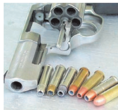
Diferentes tipos de cartuchos del calibre .38 Spl.

A pesar de contar con más de un siglo de vida a sus espaldas, hoy en día el .38 Special sigue siendo una de las municiones más fabricadas y difundidas por todo el planeta. En este sentido, las grandes marcas del sector como Winchester, Remington, Federal, Magtech o CCI, entre muchas otras, producen múltiples variedades de este calibre. De punta hueca, con proyectil de plomo, con punta blindada, semi-blindada... la lista es tan larga como su trayectoria en el mundo del tiro defensivo y deportivo. Como vemos, la fama del .38 Special va mucho más allá de haber sido el calibre del mítico revólver Colt Detective Special, o de haber sido el triste protagonista del asesinato de John Lennon. Su popularidad obedece más a sus excelentes condiciones como munición de defensa y para tiro de precisión.