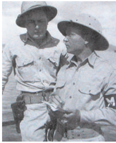
Dos policías militares en Nueva Guinea.