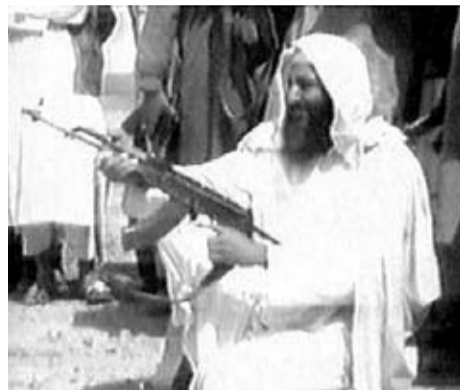
Esta famosa imagen de Osama Bin Laden con un AK47 dio la vuelta al mundo.

Alemania del Este durante la Guerra Fría. Este modelo se caracteriza por disponer de culata metálica plegable, piolet y guardamanos de plástico, y por disparar cartuchos del calibre 7,62x39mm. La presencia de fusiles tipo AK en la película “En tierra hostil” se acentúa en la escena donde entran en acción los contratistas privados. Ellos van armados con modernos rifles Kalashnikov customizados con monopods delanteros y miras ópticas de tritio auto-iluminadas.