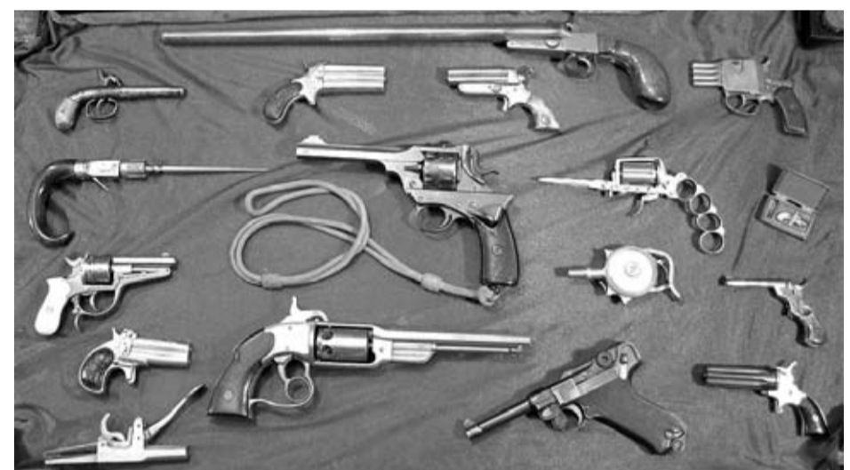
Una perfecta combinación entre armas cortas históricas y algunos ejemplares "curiosos".