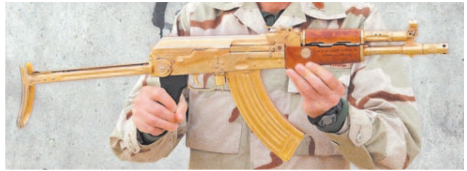
Esta popular imagen de un AK47 estampado en oro demuestra la enorme fama de este fusil.

Los principales defensores del fusil ideado por Mikhail Kalashnikov consideran que lo que realmente hace especial al AK es que su creador lo diseñó con el objetivo de que se convirtiera en un arma que protegiera la vida del soldado. De este concepto de arma defensiva emergen algunas de sus características más importantes, como por ejemplo que funcione a la perfección en cualquier ambiente o escenario (con barro, con agua, con arena, etc). Kalashnikov consiguió esta espectacular fiabilidad apoyándose en el mecanismo de acción conocido como toma de gases. Así, para recargar automáticamente el fusil, el AK usa los gases de combustión generados tras cada