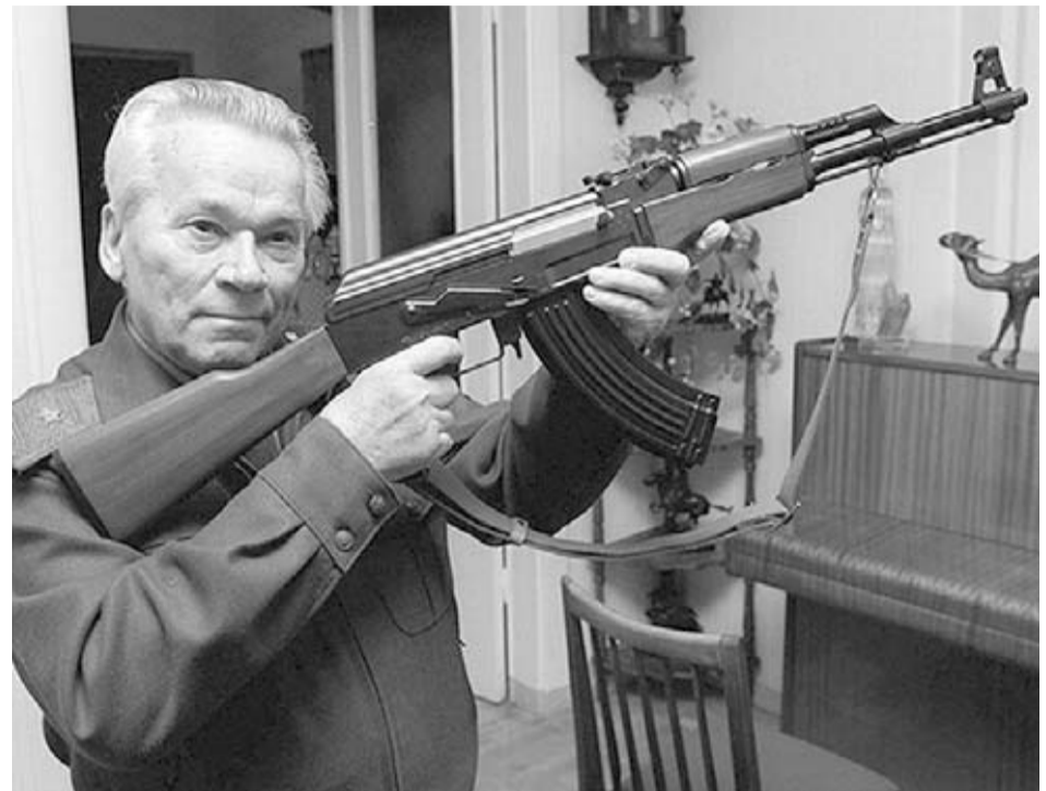
El ruso Mikhail Kalashnikov posa junto a su inseparable compañero: el AK47. Mikhail diseñó los primeros esbozos de este mítico fusil mientras se recuperaba de un disparo en el hospital.

Los primeros AKs se distinguen por tener el cajón de mecanismos de acero sólido