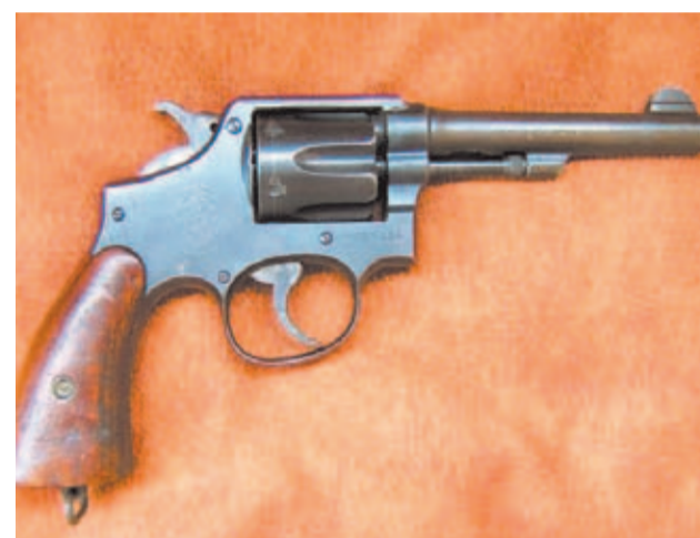
Su sencillez de mecanismos fue una de sus grandes virtudes.