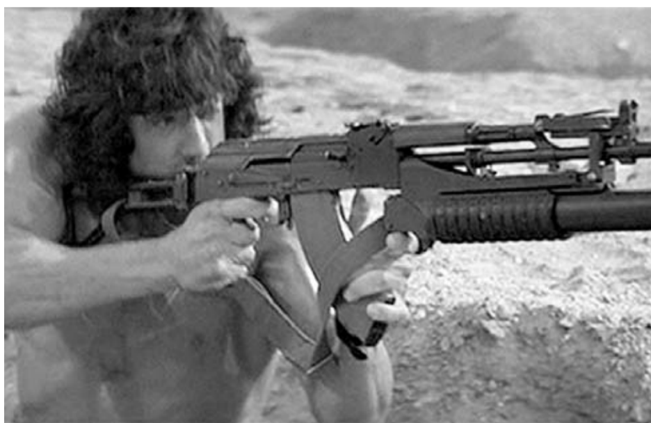
Las licencias que suele tomarse la industria cinematográfica terminan por mostrarnos extrañas combinaciones como esta que vemos en “Rambo 3”: un AK con el lanzagranadas del M16.