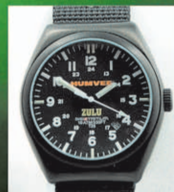
HUMVEE ZULU Desde 120 Euros

La empresa mb-microtec fabrica los dispositivos de Tritio en Berna (Suiza). Se trata de una tecnología que se instala únicamente en los mejores relojes tácticos del mundo. Este sistema garantiza la máxima visibilidad del reloj en situaciones de absoluta oscuridad, sin necesidad de apretar ningún botón. Las fuerzas especiales de todo el mundo utilizan relojes de Tritio.