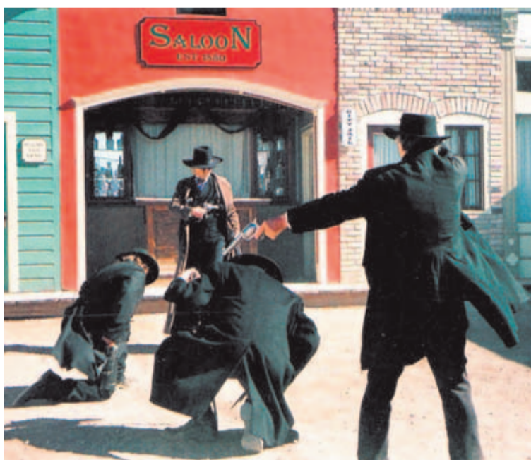
Los enfrentamientos armados en el Far West solían ser a vida o muerte.

Él presumía de haber matado a más de cien hombres a lo largo de su vida, pero a día de hoy, y con estudios muy detallados, se cree que en toda su vida no llegó a treinta abatidos confirmados. La prensa del momento y los novelistas alimentaban la imaginación de sus lectores, atribuyendo a Hickok, y a otros “ases” del momento, cientos de muertes. Tanto es así que a nuestros días nos llegan conceptos equivocados y exagerados de lo que de verdad ocurría en esas violentas ciudades. Nuestro personaje está en el elenco de las diez personas más mortales de la historia. Existe publicada una obra literaria que lleva por título: “Los 10 Hombres más Mortíferos de la Historia”, y Hickok está entre ellos. Parece que el último malhechor al que abatió mientras era Agente de la Ley, se le enfrentó a solo tres metros de distancia. El 5 de octubre de 1871, según consta, el Comisario le ordenó a un vaquero que tirara sus armas al suelo (estaba prohibido portar armas en la ciudad) pero el vaquero, lejos de obedecer la legítima orden “policial”, le disparó 2