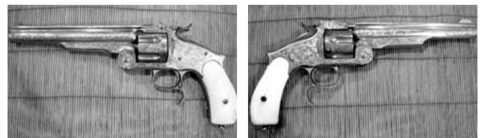
Detalle del revólver Smith & Wesson Russian, el preferido del coleccionista español.