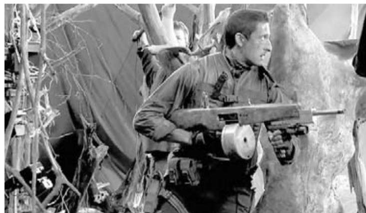
El actor Adrien Brody porta una escopeta AA-12 en la película "Predators".

sometieron a exigentes pruebas para finalmente declinar su adquisición masiva. En los últimos tiempos parece que esta temible escopeta ha despertado cierto interés entre los productores cinematográficos, quienes han decidido exhibirla en algunas de sus películas. Es el caso de títulos recientes de la gran pantalla como "Los Mercenarios", "Predators", o "G.I.J.O.E."