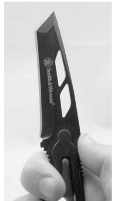
Detalle de la hoja del Black Tanto.