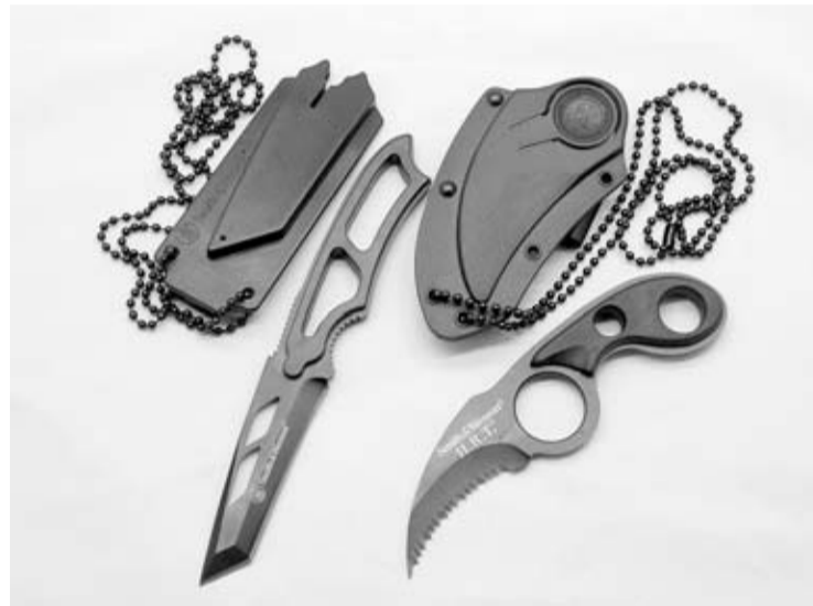
Los dos modelos analizados junto a sus fundas y colgantes.

Las siglas H.R.T. (Hostage Rescue Team, o equipo de rescate de rehenes) que acompañan a este pequeño cuchillo de Smith & Wesson indican el principal uso que se le puede dar a esta arma blanca de cuello. Dadas sus reducidas dimensiones (su longitud total apenas alcanza los 15cm), el Smith & Wesson H.R.T. es una opción perfecta para portar como segundo cuchillo o cuchillo de último recurso. Sus cachas están fabricadas con Zytel, un polímero altamente resistente que asegura un agarre firme y eficaz. La opción de poder portarlo colgan-