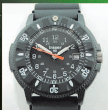
Traser 6500 Desde 199 Euros