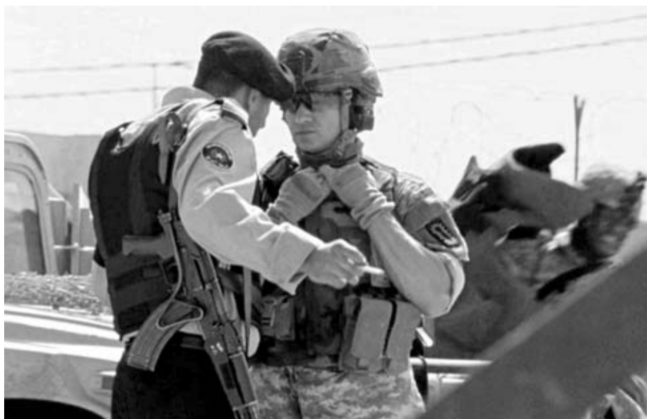
En esta imagen de “En tierra hostil” sale un policía armado con un MPI-KMS, una variante del AK.

Todos estos ejemplos, unidos a su confirmada presencia en los conflictos armados más importantes de los últimos años, demuestran que el arma ideada por Kalashnikov sigue muy vigente en nuestra sociedad. Y si por alguna de aquellas a algún aficionado a las armas se le ocurriera olvidarse de lo que representan las siglas AK, en la ciudad de Izhevsk se puede visitar un museo completamente dedicado a este legendario fusil de asalto. El legado AK continúa, y veremos si se detiene en 2025. Por ahora, no lo parece.