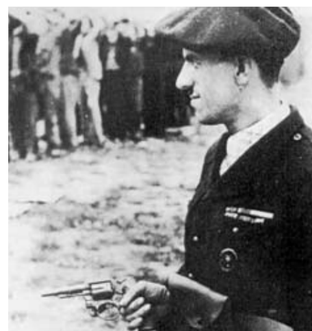
Colaborador nazi armado con un S&W M&P.

que fallaban, mandándose de nuevo a Europa para armar a las fuerzas policiales de los países vencidos. Yo mismo he visto uno de estos Victory con la palabra Öste-