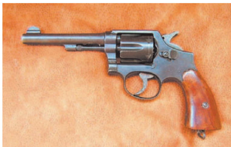
El Smith & Wesson M&P está elaborado con materiales muy resistentes.

En 1932 el Ejército Británico adoptó un ligero revólver de apertura superior, el Enfield N° 2 Mark I. Que eligieran un