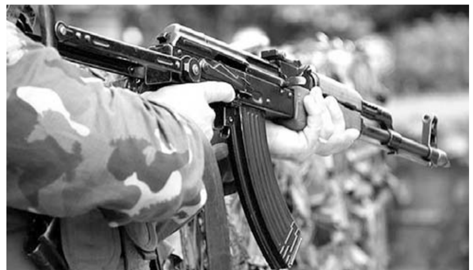
El AK47 destaca por su espartano y rudimentario diseño. Esta sencillez fue clave en su éxito.

mático de similares características para equipar a las huestes soviéticas. Así, durante su estancia en el hospital de campaña y mientras sanaban sus heridas, Mikhail estudió con detenimiento el funcionamiento de los subfusiles alemanes, sobre todo el MP44.