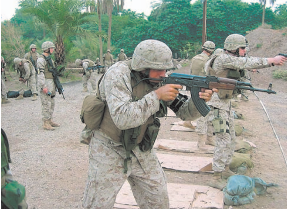
Los militares de todos los ejércitos (incluido el US Army) valoran las numerosas cualidades del AK.

Kalashnikov, quien lejos de amilanarse, decidió volver a probar suerte con una nueva arma. Esta vez el joven mecánico de carros de combate presentó una ametralladora ligera con el mismo funcionamiento por retroceso de masas, pero que, lamentablemente, corrió la misma suerte que su predecesora. Corría por aquel entonces el año 1943, y tan sólo un año después, el testarudo Kalashnikov volvió a intentarlo, en esta ocasión con una carabina semiautomática que empleaba el mismo cerrojo y cargador del Garand estadounidense. Sin embargo, esta vez su arma se vio superada por la "criatura" de otro gran diseñador: Sergei Gavrilovich Simonov, padre del legendario SKS 45. Tras la conclusión de la Segunda Guerra