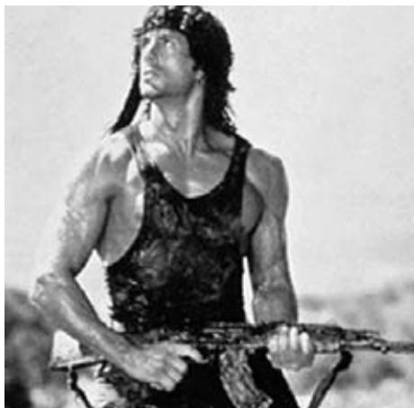
El inolvidable Rambo armado con un AK 47.

Dentro de lo que serían las apariciones más recientes del AK en la gran pantalla destaca su papel en la oscarizada “En tierra hostil”. Esta película ambientada en la guerra de Irak refleja el trabajo diario de un comando especializado en la desactivación de explosivos. A lo largo del metraje, los soldados estadounidenses se enfrentan con varios insurgentes iraquíes, quienes en varias ocasiones aparecen armados con rifles AK. Como nota curiosa, en una de las secuencias de la película podemos ver un MPI-KMS, una poco conocida versión del rifle Kalashnikov que se fabricó en la