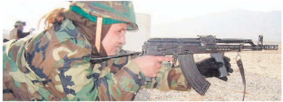
Una soldado realiza prácticas de tiro con un moderno ejemplar del rifle diseñado por Kalashnikov.

Mundial (1945) el ejército soviético organizó un nuevo concurso para elegir el fusil de asalto de dotación oficial para sus tropas. A estas pruebas Kalashnikov acudió con un nuevo prototipo caracterizado por su funcionamiento por toma de gases, su cajón de mecanismos abierto por la parte superior y por disponer de la palanca del seguro en el lado derecho del fusil. Corría el año 1946 y ese prototipo sería el arma que posteriormente se convertiría en el archiconocido Avtomat Kalashnikova 1947. Sin