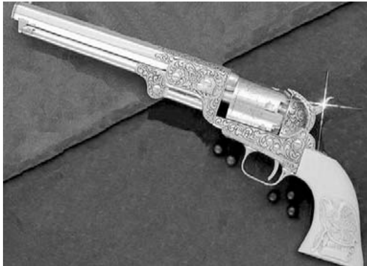
Revólver Colt Navy 1851, el arma preferida de W. B. Hickok.

Hickok siempre tomaba precauciones. Nunca se sentaba dando la espalda a las puertas de los lugares en los que se encontraba. Iba armado siempre, ocultando a