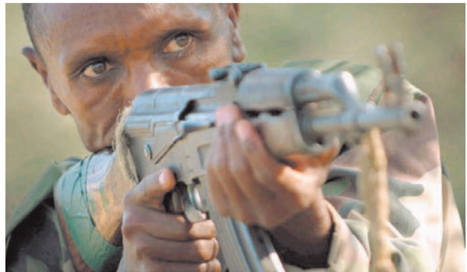
EL AK47 ha tenido un protagonismo destacado en diversos países del continente africano. En esta imagen aparece un soldado de Etiopía armado con uno de estos fusiles.