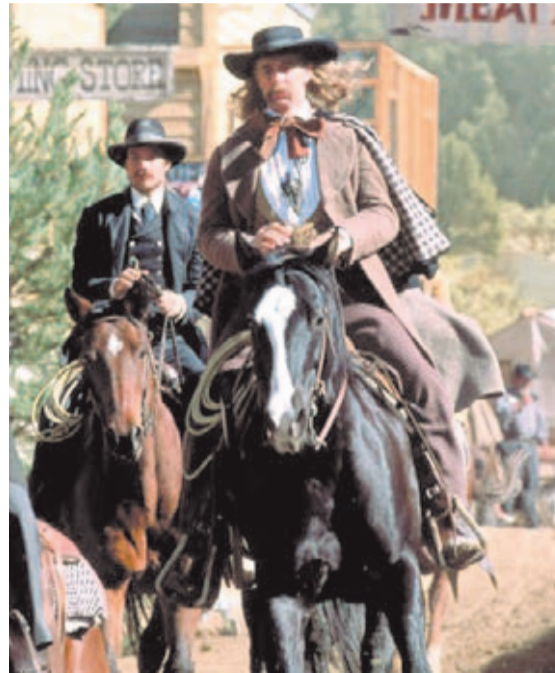
En el Salvaje Oeste nunca había que bajar la guardia.