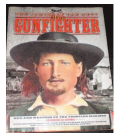
Obra recopilatoria de episodios del Salvaje Oeste. Hickok es la portada.

Cuando trabajó para el ejército acumuló tras de sí un buen número de historias que le otorgaban numerosas bajas en combate contra los indios y los mexicanos. No todas las bajas que rodeaban a estas leyendas fueron bajas contrastadas, pero desde luego, se sabe que muchas de las cifras fueron reales. Pues bien, este personaje tan habituado a las armas en una época en la que quien que no fuera el mejor moría, fue, como antes decía, Comisario en Albilene. Solo ocupó el puesto durante 8 meses, y en ese tiempo parece que abatió, en defensa de la Ley, a muy pocas personas; cuando acabó su contrato como Jefe de Policía solo había abatido a cinco contrincantes. Pero debido a su demostrada habilidad en el manejo de las armas, (revólveres) y a la velocidad de su desenfundar, su reputación y fama ganaban al número de bajas que realmente había causado. Así fue alimentándose la leyenda.