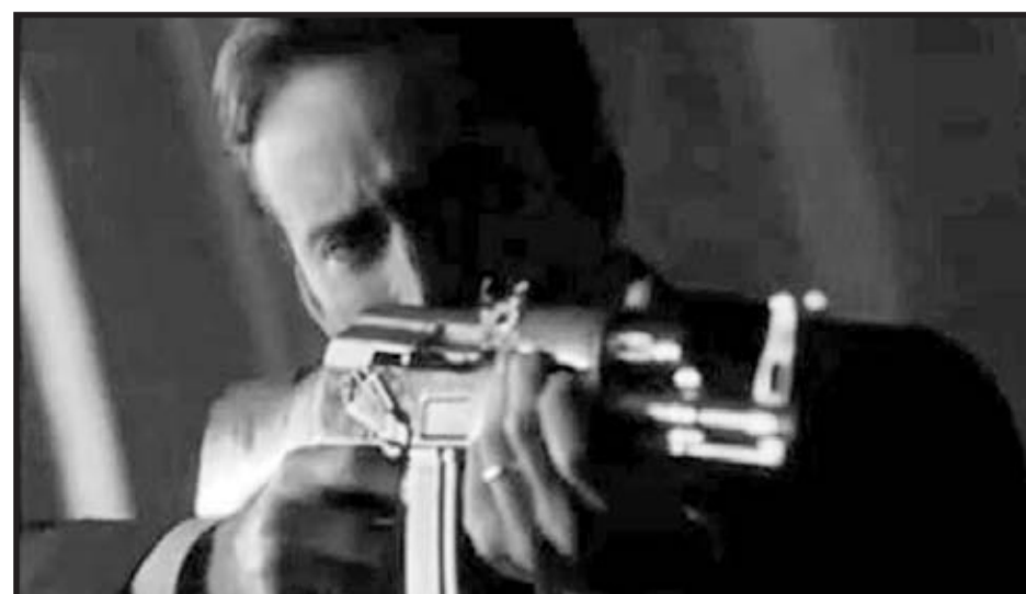
Cage alabando un AK47 en “El señor de la guerra” www.armas.es/videos