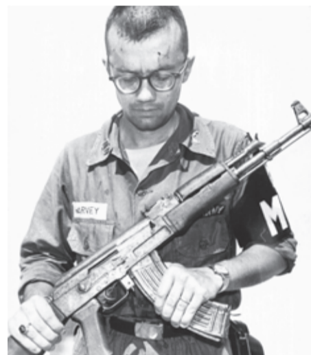
Soldado estadounidense con un AK capturado.