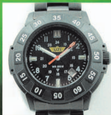
UZI Protector Desde 109 Euros