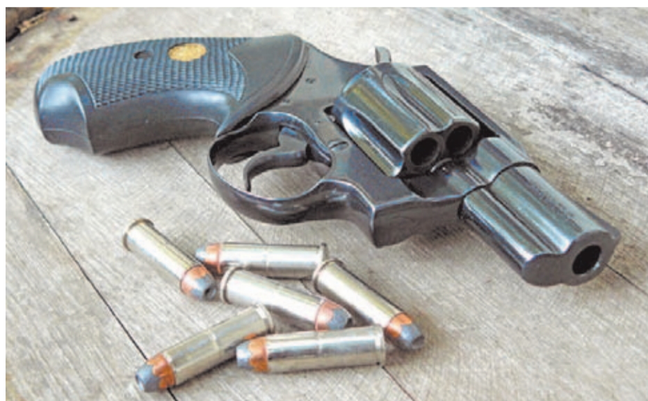
El .38 Spl ha acompañado a grandes clásicos del tambor, como este Colt Detective. / Ed Buffalce

Dada su excelente acogida entre los tiradores de todo el mundo, los grandes fabricantes de armas apostaron por diseñar revólveres preparados para disparar esta munición. Como es lógico, dado que fue su impulsora, dentro de este elenco la compañía de Springfield acaparó casi todo el protagonismo, con modelos tan emblemáticos como los de la serie J (revólveres