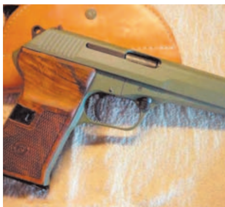
Bonito modelo de CZ-52 con cachas de madera.

Conocida indistintamente como CZ-52 o Vz-52, esta pistola pasó a la historia por ser una de las primeras en utilizar el cierre de rodillos. Este innovador sistema, diseñado por el armero checo Budichowsky (padre de la mítica pistola Korriphila HSP-701), ayudó a diferenciar a la CZ-52 de todas las armas cortas de su época. Y es que, a pesar de estar bajo la influencia comunista de la URSS, la industria armamentística checoslovaca logró mantener cierta independencia en temas de armamento, lo que le sirvió para crear grandes modelos. Uno de ellos es precisamente esta CZ-52, una pistola de simple acción ideada por los hermanos Kratochvil y que usaba la potente munición 7,62x25mm. Sin embargo, no era este el único calibre que funcionaba correctamente en la CZ-52. Otros cartuchos como el 7,63 Mauser de la C-96 o el 7,62 Tokarev de la TT-33, podían equiparse con total normalidad en la pistola checa, una característica