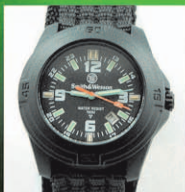
S&W Soldier Desde 100 Euros