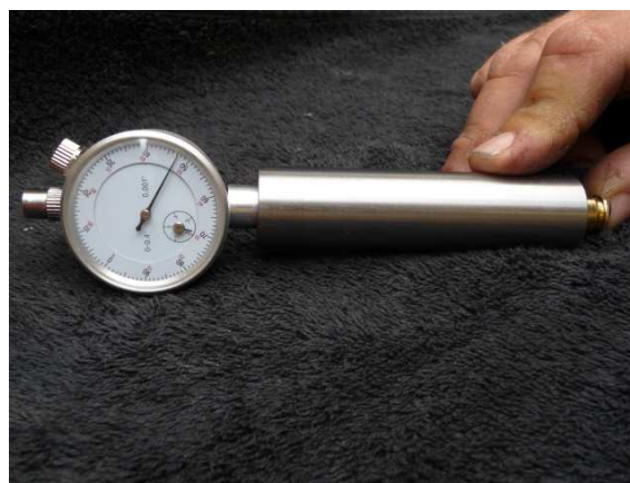
Comparador con cartucho insertado mostrando el ajuste requerido para el Seating Die