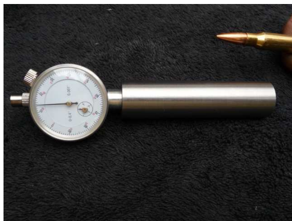
Comparador sin cartucho insertado

El comparador está ahora ajustado para indicarte la longitud correcta de la munición recargada, permitiendo de forma precisa y medible bien insertar la punta en las estrías o bien retirarla de ellas en proporciones medibles. Utiliza el comparador cuando ajustes tu Seating Die para obtener la longitud deseada del cartucho (COL). En su configuración actual el comparador te dirá dónde estás colocando la punta si antes o dentro de las estrías sencillamente mirando su dial, por ejemplo, 0.010 antes del Cero te indica la distancia que falta hasta las estrías mientras que 0.010 tras el Cero indica la distancia que estás introduciendo la punta en las estrías. Esto además te permite un sencillo y rápido sistema para comprobar cada cartucho que has cargado.